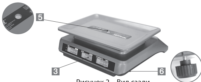
Рисунок 2 – Вид сзади