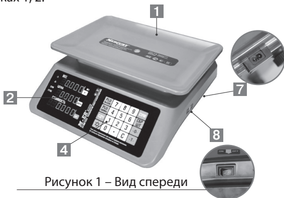
Рисунок 1 – Вид спереди